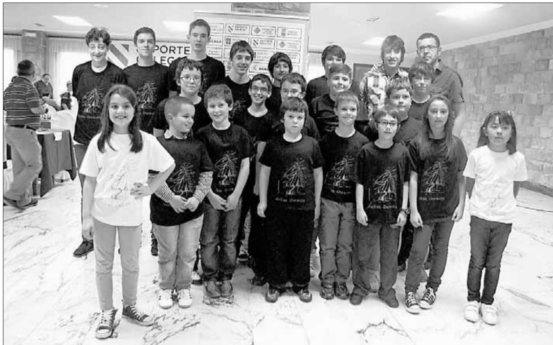
Componentes del equipo del Club Xadrez Ourense en el campeonato de Galicia.