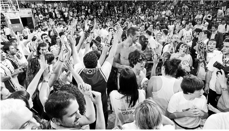
Los aficionados santiagueses celebran el ascenso.